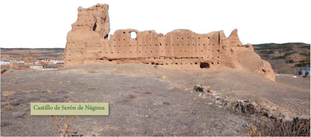
Castillo de Serón de Nágima

En el mismo sentido de la marcha andamos 50 m por la carretera en dirección sur hasta tomar el primer desvío a la izquierda por camino de rodadura. Tras cortar un arroyo, al lado un grupo de grandes chopos,