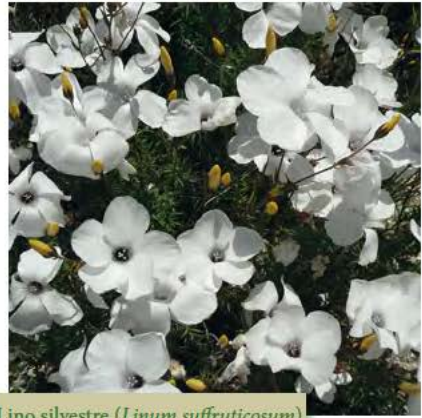
Lino silvestre ( Linum suffruticosum )

Andado poco más de un kilómetro la subida finaliza en una encrucijada de caminos donde se pueden ver corpulentos ejemplares de sabinas albar que crecen en una zona empradizada. Sin variar apenas el rumbo seguimos hacia la izquierda y nos volvemos a adentrar de nuevo en zona de cultivos, ahora por una línea de altos, hasta otra encrucijada. Giramos a la izquierda e iniciamos el descenso hacia una vaguada muy abierta donde se divisan unos chopos grandes. Bajo estos árboles se encuentra la fuente de la Mariblasca, donde podemos