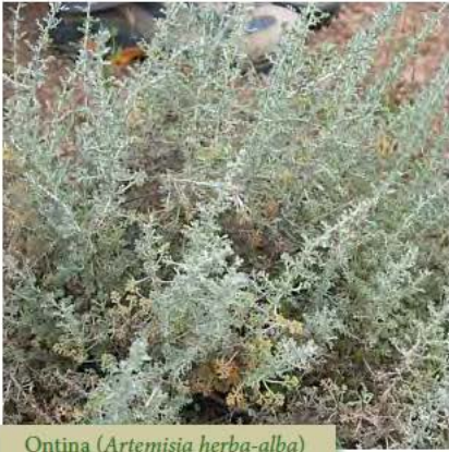
Ontina ( Artemisia herba-alba )