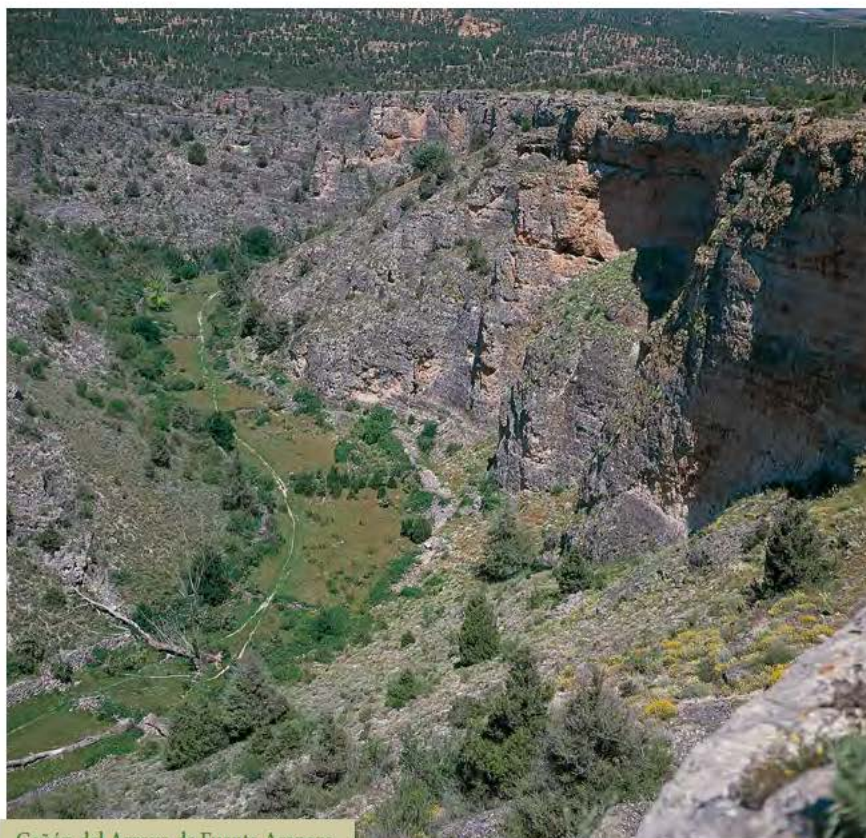
Cañón del Arroyo de Fuente Arenaza

un camino que surge tras cruzar la carretera. Este camino entra en la localidad de Recuerda después de tomar, al poco de su inicio, un primer desvío a la izquierda.