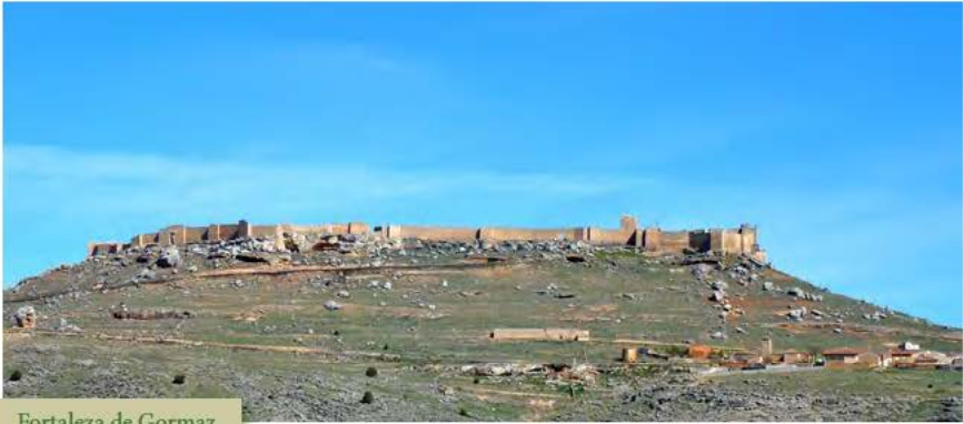
Fortaleza de Gormaz

cado en el páramo, al sur de la provincia. Ante la humildad de su casco urbano llama la atención la iglesia de San Juan Bautista, de estilo barroco del siglo XVII y finalizada a principios del siglo XVIII. Así mismo destaca el Palacio de Brías, edificio blasonado construido en piedra de sillería que tiene un patio central con balconada de madera, actualmente posada rural. La iglesia parroquial y el Palacio de Abanco poseen similares características que los de su vecino Brías. En ambos pueblos sus promotores fueron tío y sobrino, ambos obispos, naturales de Brías. Su entorno es un paisaje áspero, pero de una extraña belleza, de tierras grises aferradas a cielos azules, donde nos embarga un sensación de sosiego ante su profunda soledad.