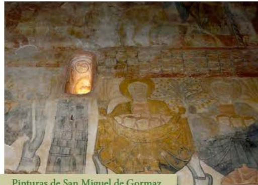
Pinturas de San Miguel de Gormaz

Este camino estrecho apunta hacia el margen izquierdo de una marcada vaguada. Enseguida inicia su ascenso a media ladera entre sabinas y, tras tres kilómetros recorridos, después de atravesar una franja de pinar de repoblación, alcanza el punto más alto de la etapa, en un amplio collado con una encrucijada. Ahora se divisa la aldea de Brías inmersa en un paisaje agrícola. Sin dejar el camino, desciende un kilómetro más hasta la carretera, por la que seguirá recto para concluir la etapa en Brías.