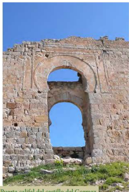
Puerta califal del castillo del Gormaz

Cruza el pueblo por la carretera en dirección al castillo y, nada más salir, se desvía a la izquierda por un camino antiguo, por el que desciende hasta el mismo puente del río Duero. Cruza el puente por la carretera y enlaza recto con